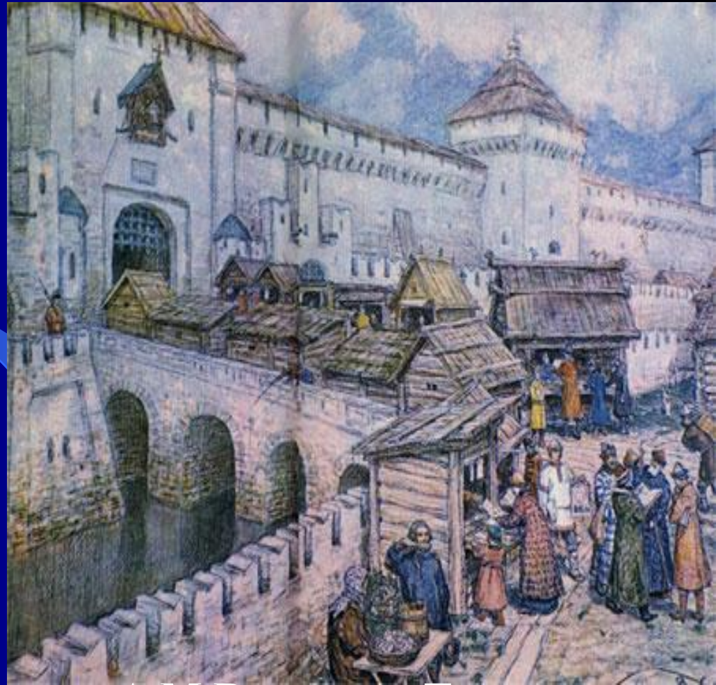
А.М.Васнецов. Торговые лавочки...

В стране появляются рынки, торжки, ярмарки-Архангельская, Ирбитская, Свенская, Макарьевская. Здесь торговля шла крупными оптовыми партиями. Широко развивалась торговля в разнос. В торговле также стала складываться специализация, например в Черноземье и в Поволжье возникли центры продажи зерна.