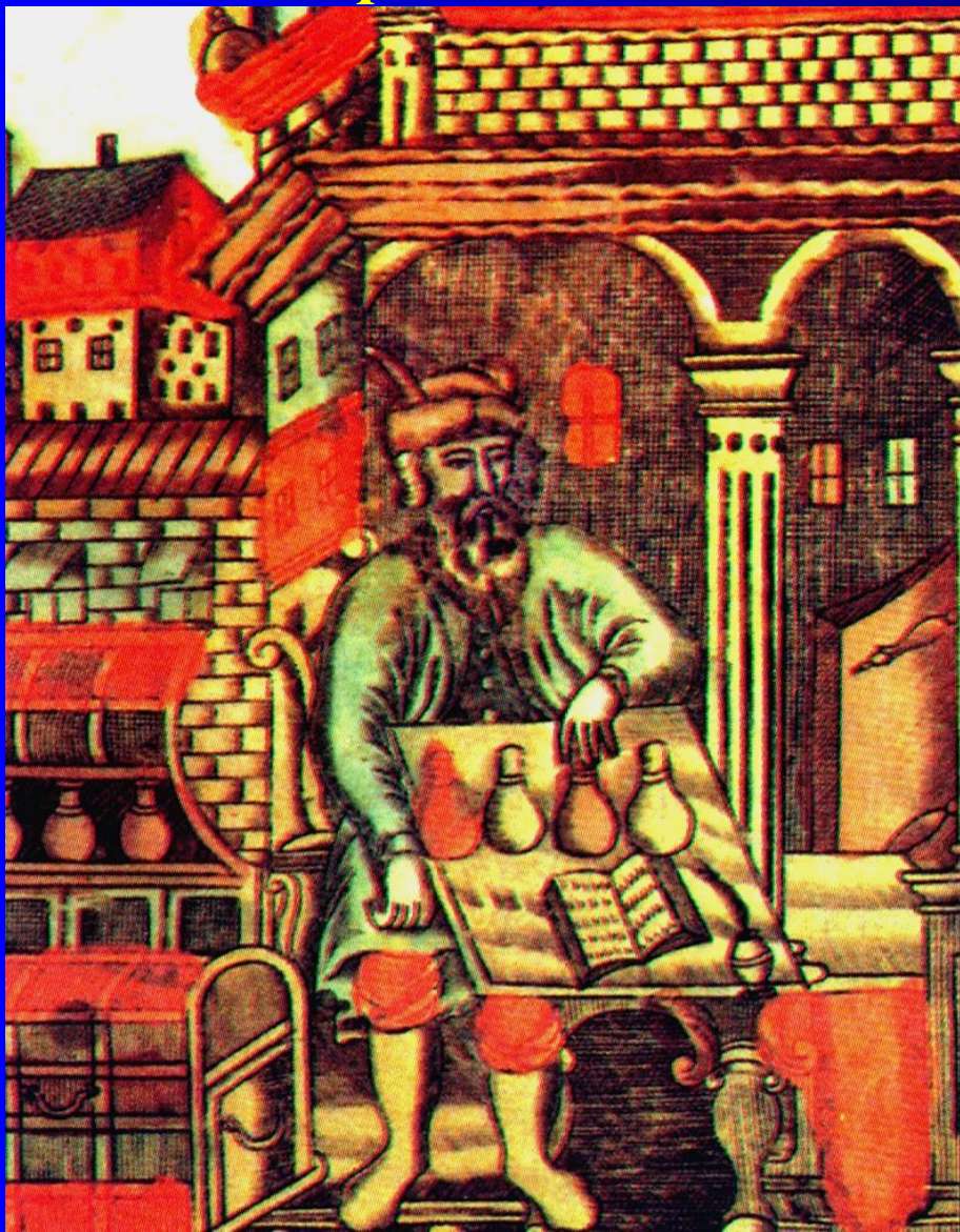
Купец, считающий деньги. Миниатюра 17 в.

В сер. XVII в. защищая интересы русских купцов правительство выслало из страны английских торговцев. В 1653 г. был принят Таможенный устав ликвидировавший мелкие таможенные пошлины внутри страны.