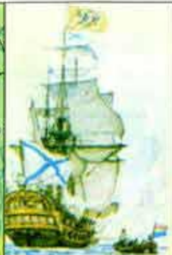
Военный корабль. XVIII век