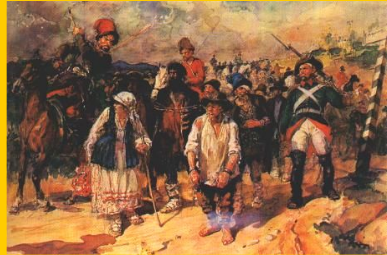
Г.Савицкий. «Пригон рабочих на уральский завод».

■ Капиталистский крестьянин – крестьянин, занимавшийся предпринимательством, имевший солидный капитал.