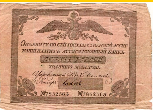
Ассигнация при Екатерине II