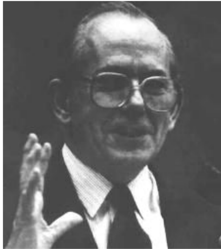
Мишель Камдессю. Распорядительный директор МВФ.

МВФ поставил перед правительством задачи-снизить социальные расходы, дать гарантии иностранным инвесторам, снизить инфляцию.