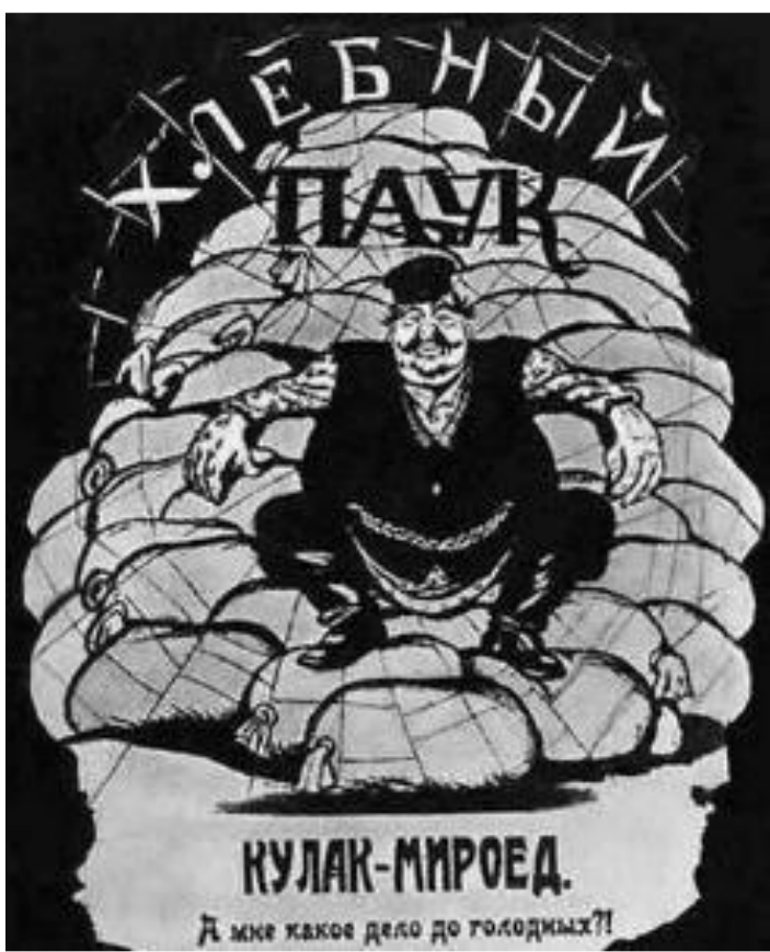
В.Дени. Хлебный паук.

В начале для получения продовольствия правительство использовало товарообмен, но в условиях развала экономики промышленных товаров не хватало и крестьяне не спешили отдавать хлеб государству в обмен на реквизиционные чеки. Над страной нависла угроза голода. В столицах выдавали по 50-100 г хлеба в сутки на человека. 13 мая ВЦИК установил душевые нормы потребления хлеба для крестьян. Весь хлеб сверх установленной нормы подлежал конфискации.