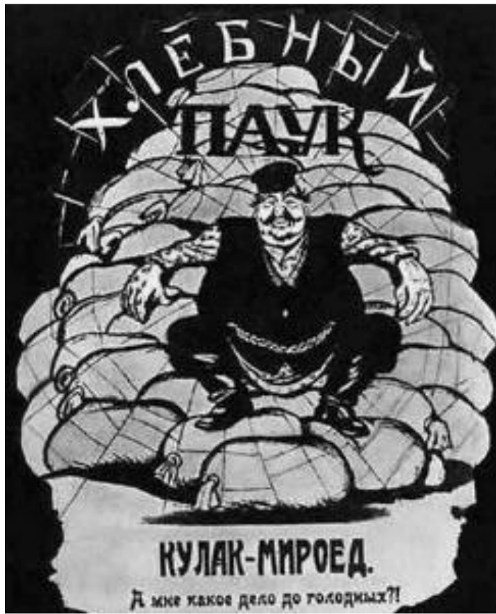
В.Дени. Хлебный паук.

В начале для получения продовольствия правительство использовало товарообмен, но в условиях развала экономики промышленных товаров не хватало и крестьяне не спешили отдавать хлеб государству в обмен на реквизиционные чеки. Над страной нависла угроза голода. В столицах выдавали по 50-100 г хлеба в сутки на человека. 13 мая ВЦИК установил душевые нормы потребления хлеба для крестьян. Весь хлеб сверх установленной нормы подлежал конфискации.