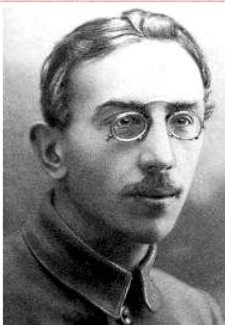
Н.Осинский- 1-й председатель ВСНХ

1 декабря 1917 г. ВЦИК образовал ВСНХ для управления и регулирования экономики страны. 14 декабря банковское дело было объявлено монополией государства. Частные банки и их средства были национализированы. В январе проводится национализация транспорта, в апреле - внешней торговли. РСФСР отказалась признать царские долги, отменила право наследования.