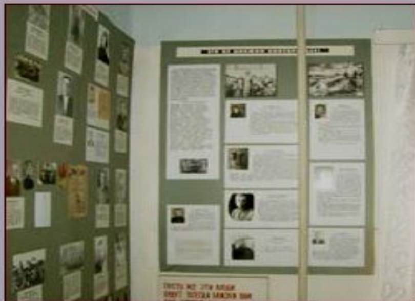
Экспозиция «ПОКЛОНИСЬ ПОДВИГУ».

О жизни селян во время оккупации фашистами познакомит экспозиция «ЭТО НЕ ДОЛЖНО ПОВТОРИТЬСЯ». Большая часть экспозиции посвящена узникам Германии. Воспоминания, фотографии, биографические справки и другие документы свидетельствуют о невероятно тяжелой жизни в неволе бывших узников фашистской Германии.