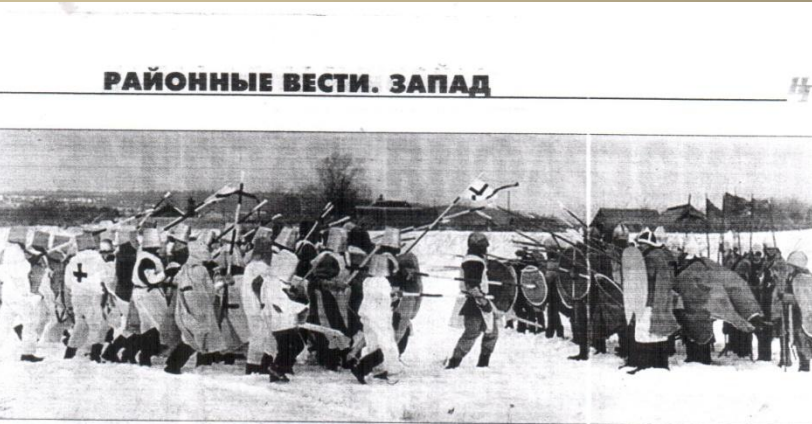
Школьники из Кузоватовского района чтят и помнят историю своей страны.