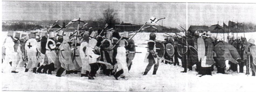
Школьники из Кузоватовского района чтят и помнят историю своей страны.