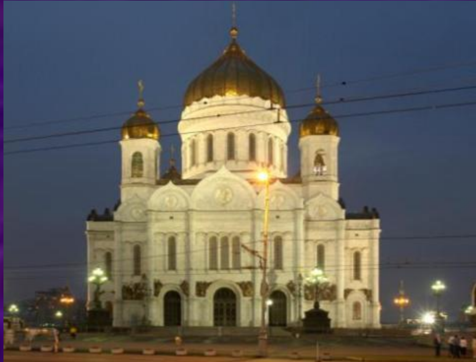
Храм Христа Спасителя в Москве