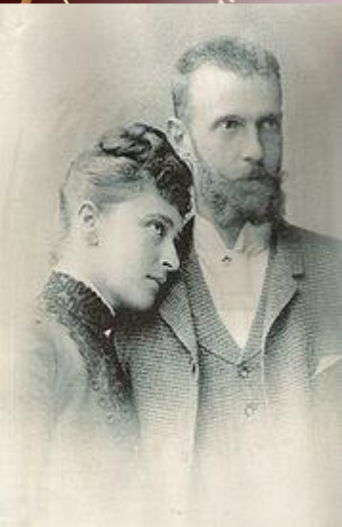
Елизавета Фёдоровна и Сергей Александрович

В качестве супруги московского генерал-губернатора В качестве супруги московского генерал-губернатора (великий князь Сергей Александрович был назначен на этот пост в 1891) организовала в 1892 В качестве супруги московского генерал-губернатора (великий князь Сергей Александрович был назначен на этот пост в 1891) организовала в 1892 Елисаветинское благотворительное общество В качестве супруги московского генерал-губернатора (великий князь Сергей Александрович был назначен на этот пост в 1891) организовала в 1892 Елисаветинское благотворительное общество, учреждённое для того, чтобы «призреть законных младенцев беднейших матерей, дотолу помещаемых, хотя без всякого права, в Московский Воспитательный дом В качестве супруги московского генерал-губернатора (великий князь Сергей Александрович был назначен на этот пост в 1891) организовала в 1892 Елисаветинское благотворительное общество, учреждённое для того, чтобы «призреть законных младенцев беднейших матерей, дотолу помещаемых, хотя без всякого права, в