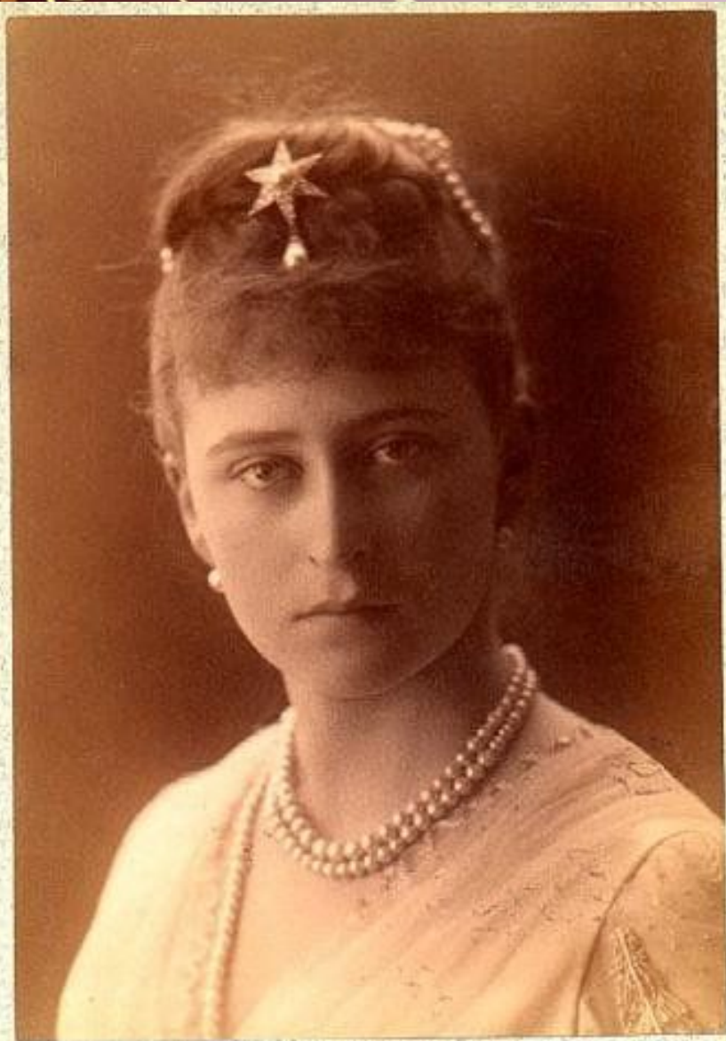
Великая княгиня Елизавета Федоровна

С началом русско-японской войны Елизавета Федоровна организовала Особый комитет помощи воинам, при котором в Большом Кремлевском Дворце был создан склад пожертвований в пользу воинов: там заготавливали бинты, шили одежду, собирали посылки, формировали походные церкви.