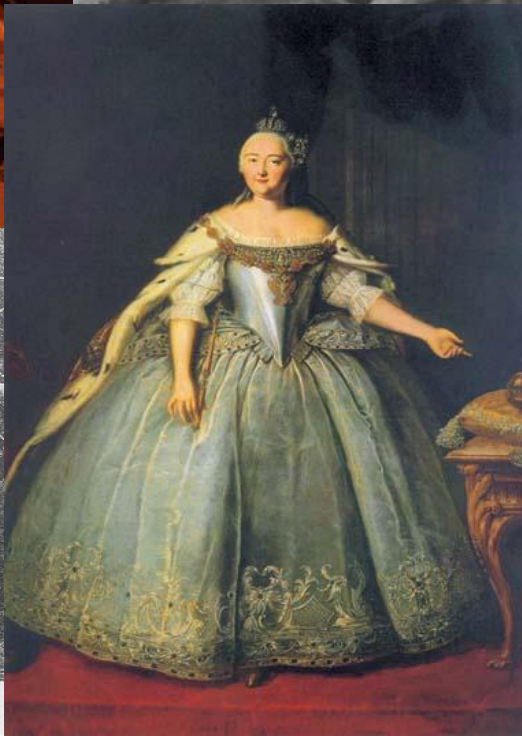
ЕЛИЗАВЕТЪ I Императрица и Самодержица Всероссийская ELISABETH I Russorum Imperatrix