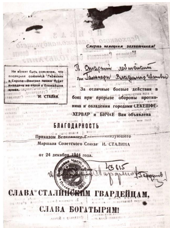
Благодарность от Сталина И.В.

Фронтвой снимок 1943 года. Выпускница РУ-5