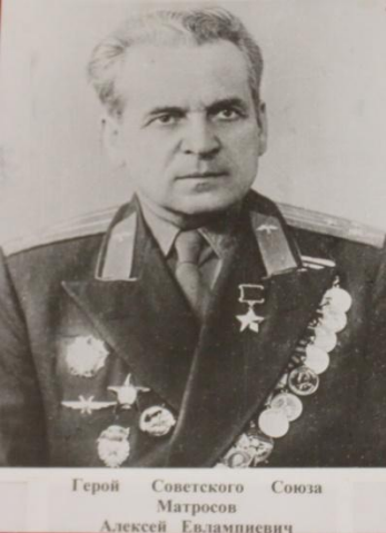
Герой Советского Союза Матросов Алексей Евлампиевич