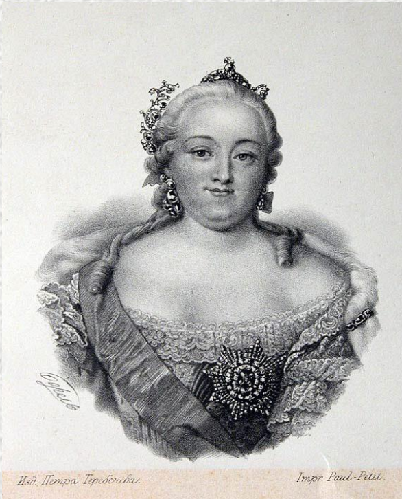
Елизавета Петровна (1741-1761гг.)

Елизавета Петровна провозгласила возвращение к порядкам своего отца – Петра I