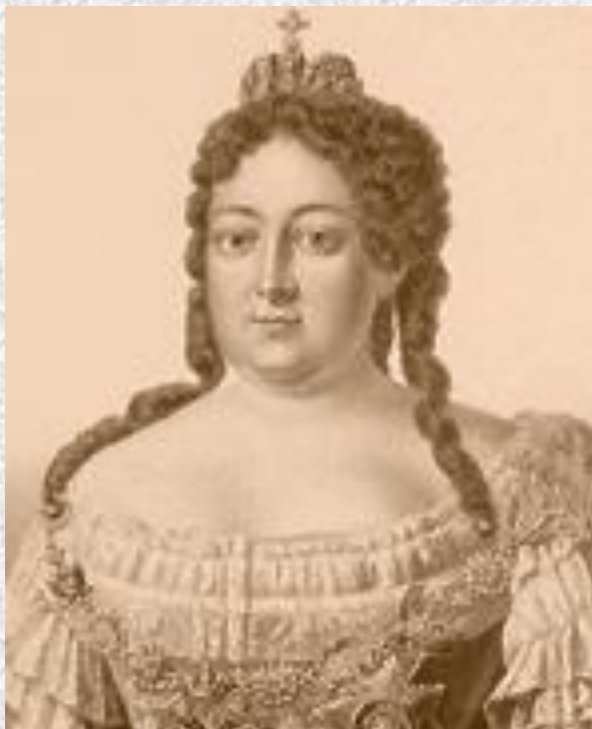
Анна Иоановна (1730 -1740гг.)