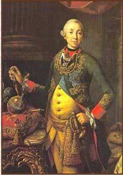
Петр III (1761-1762гг.)