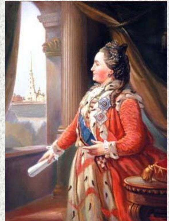
Екатерина II (1762-1796гг.)