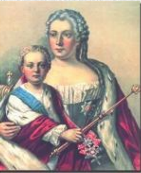
Иоанн VI Антонович с матерью Анной Леопольдовной (1740-1741гг.)