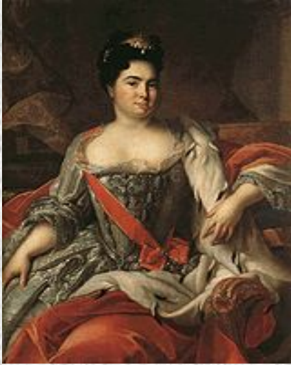
Екатерина I (1725 -1727гг.)