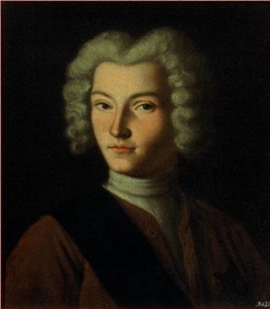
Петр II (1727 -1730гг.)