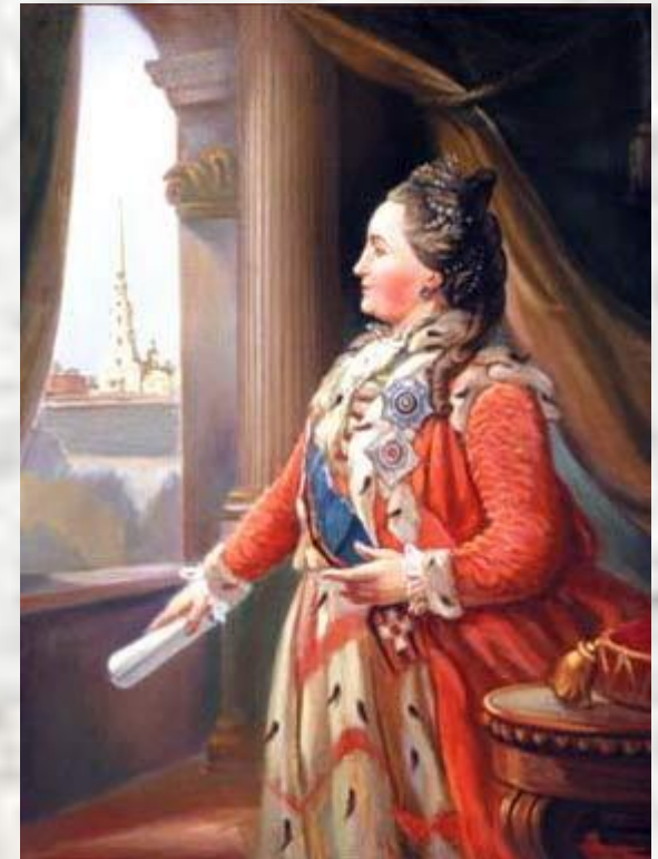
Екатерина II (1762-1796гг.)