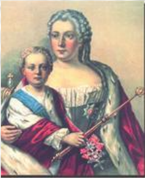
Иоанн VI Антонович с матерью Анной Леопольдовной (1740-1741гг.)