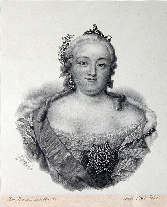
Елизавета Петровна (1741-1761гг.)

В 1742г. Она назначила преемником своего племянника Петра Федоровича – сына Анны Петровны, внука Петра I. Женив его в на немецкой принцессе Софии Августе Фредерике Ангальт-Цербсткой, которая после крещения по православному обряду получила новое имя – Екатерина (в пвмять о матери Елизаветы Петровны)