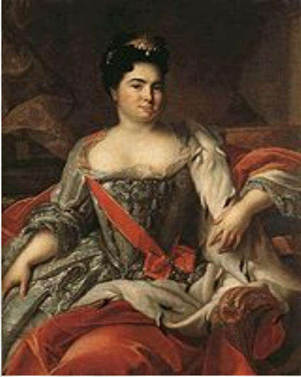
Екатерина I (1725 -1727гг.)