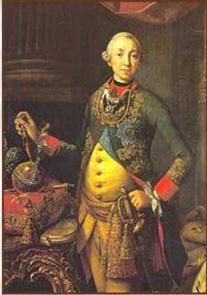
Петр III (1761-1762гг.)