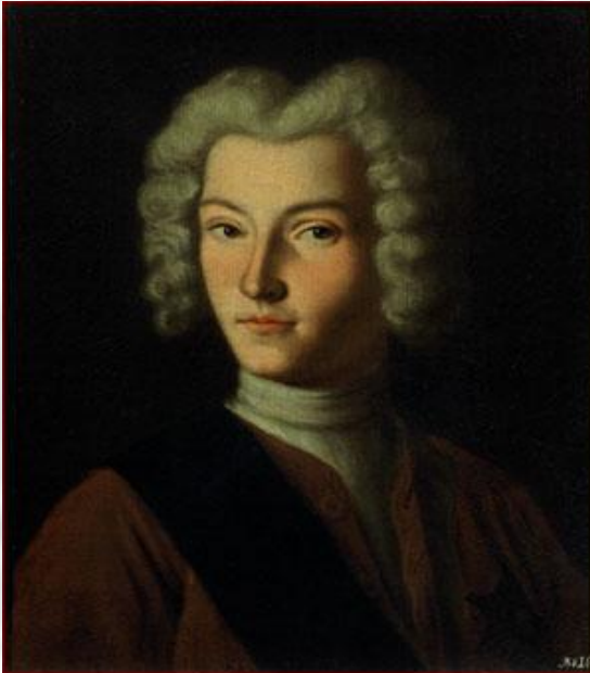
Петр II (1727 -1730гг.)