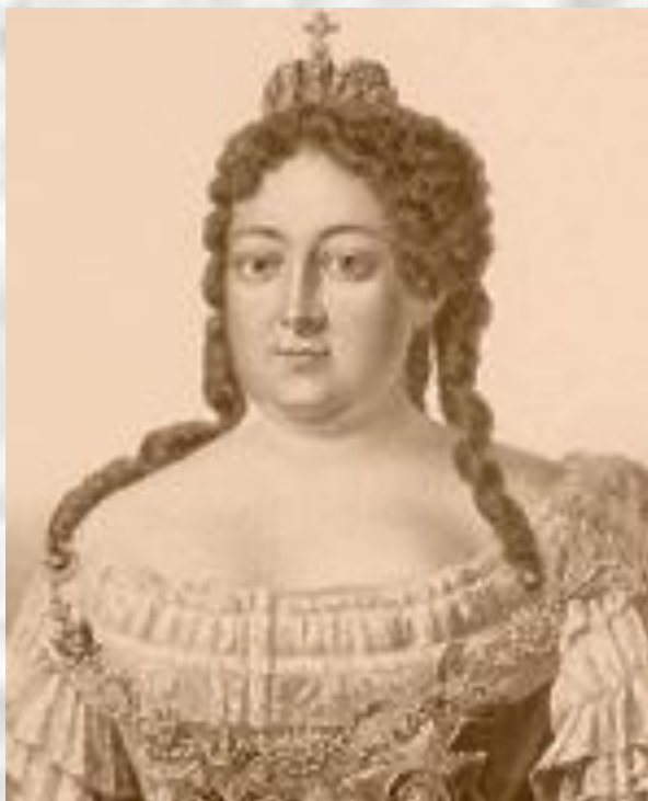
Анна Иоановна (1730 -1740гг.)