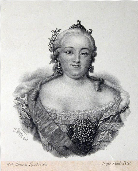
Елизавета Петровна (1741-1761гг.)

В 1742г. Она назначила преемником своего племянника Петра Федоровича – сына Анны Петровны, внука Петра I. Женив его в на немецкой принцессе Софии Августе Фредерике Ангальт-Цербсткой, которая после крещения по православному обряду получила новое имя – Екатерина (в пвмять о матери Елизаветы Петровны)