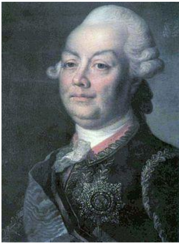
Петр Александрович Румянцев