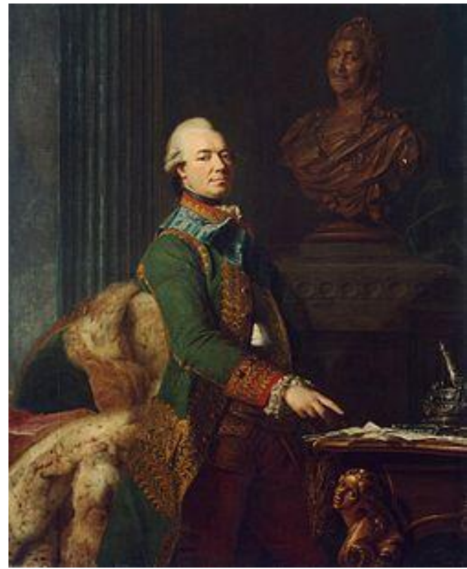
Захарий Григорьевич Чернышев