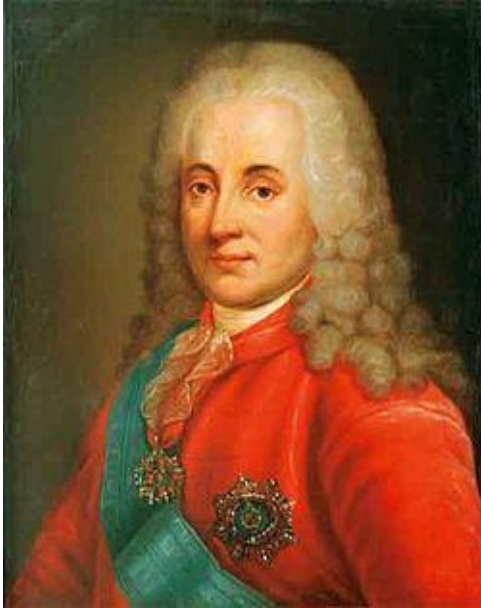
Голицын Дмитрий Михайлович