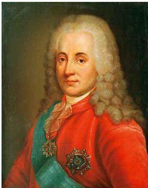
Голицын Дмитрий Михайлович