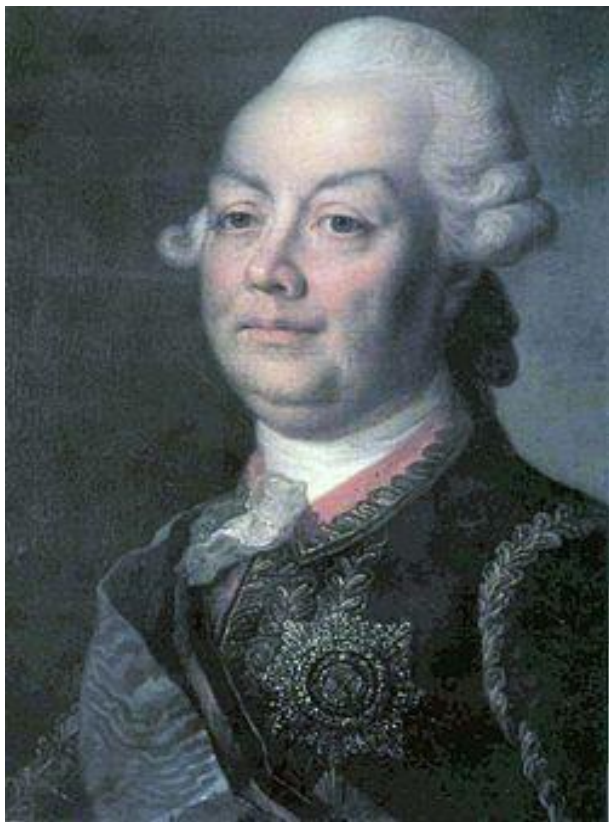
Петр Александрович Румянцев