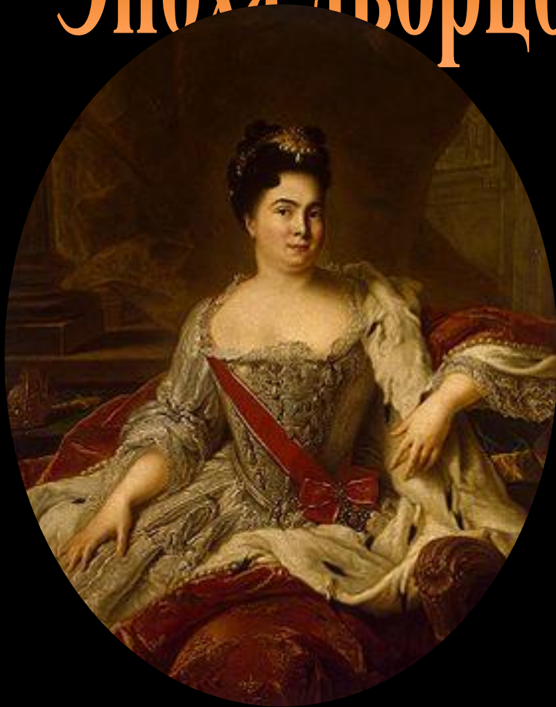
Екатерина I (1725-1727)