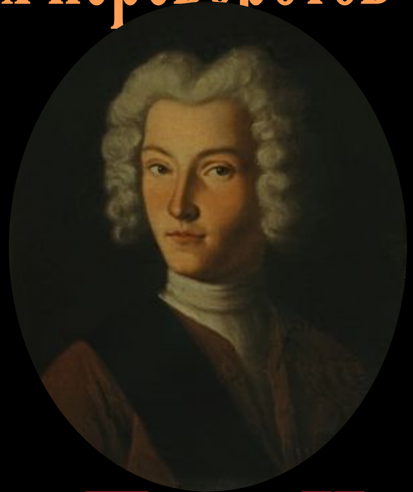
Петр II (1727 – 1730)