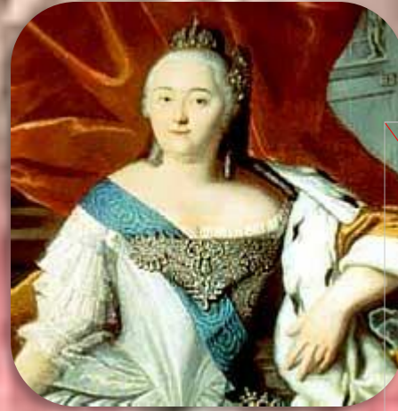
Елизавета Петровна 1741-1761