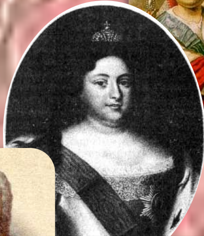
Анна Иоанновна 1730-1740