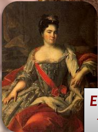
Екатерина I Алексеевна 1725-1727