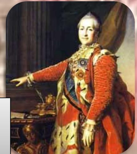
Екатерина Алексеевна 1762-1796