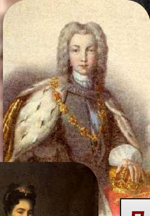
Петр II Алексеевич 1727 -1730