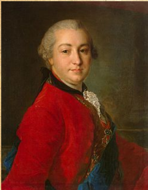
Иван Иванович Шувалов

25 января 1755 год – открытие Московского университета