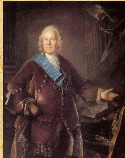
Алексей Петрович Бестужев-Рюмин

1754 год – отмена таможенных пошлин Открытие первого Дворянского банка