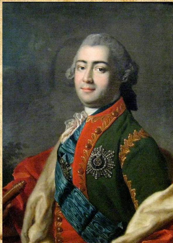
Алексей Григорьевич Разумовский

25 января 1755 год – открытие Московского университета