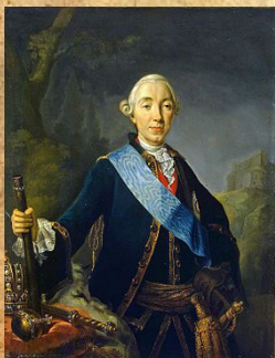
Карл Петр Улирих умерла в 1728 году