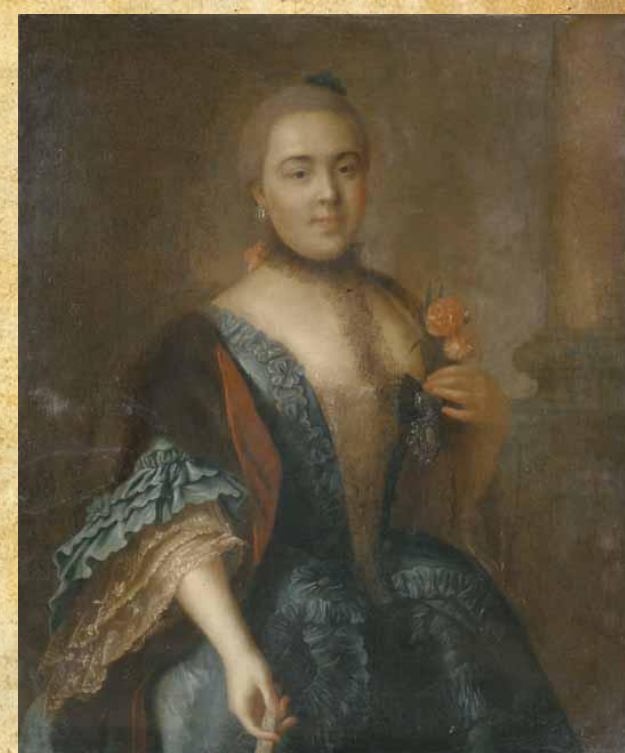
Елизавета Романовна Воронцова