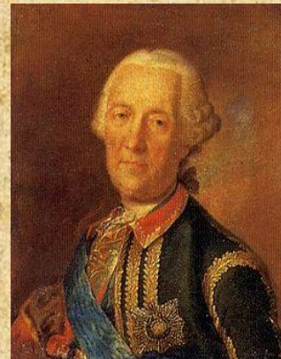
Бурхард Кристоф фон Мюнних