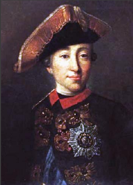
Петр III Федоровича

Россия выходила из Семилетней войны и добровольно возвращала Пруссии территорию, занятую русскими войсками, включая Восточную Пруссию.