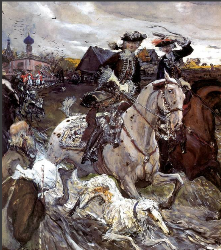
Валентин Серов. Петр II и цесаревна Елизавета на псовой охоте.

Перенёс столицу из Санкт-Петербурга в Москву.