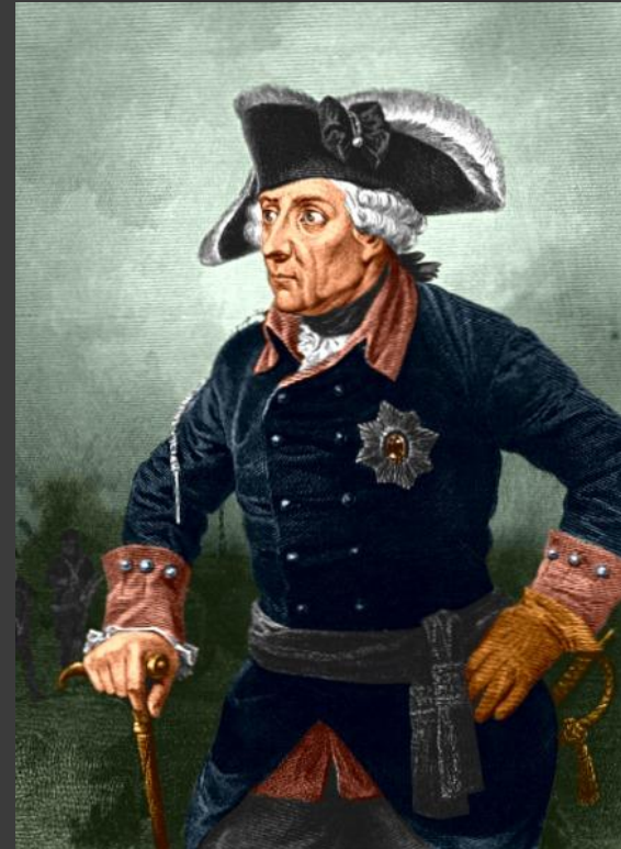
Фридрих II, король Пруссии (1712–1786).