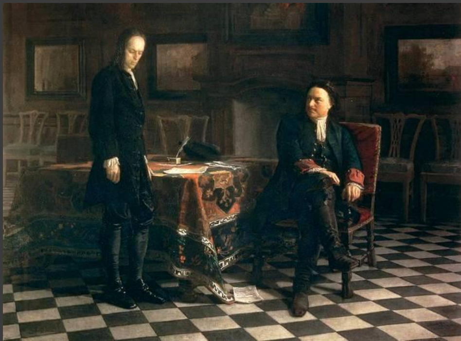
Николай Ге. Петр I допрашивает царевича Алексея Петровича в Петергофе