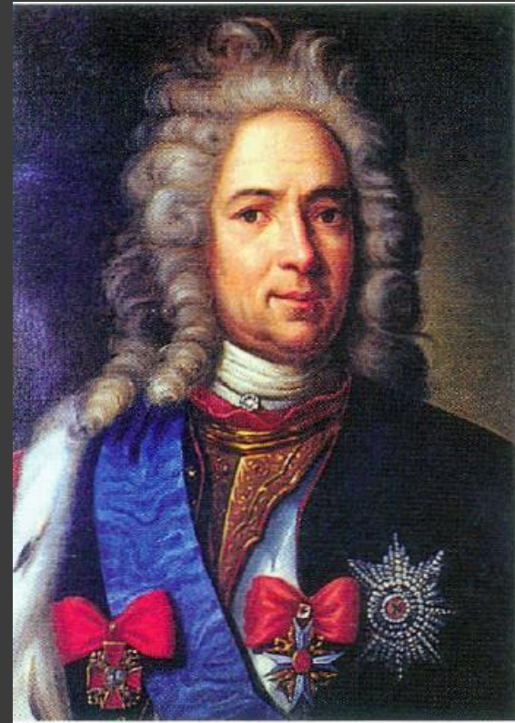
Александр Данилович Меншиков