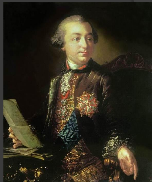
Иван Иванович Шувалов.