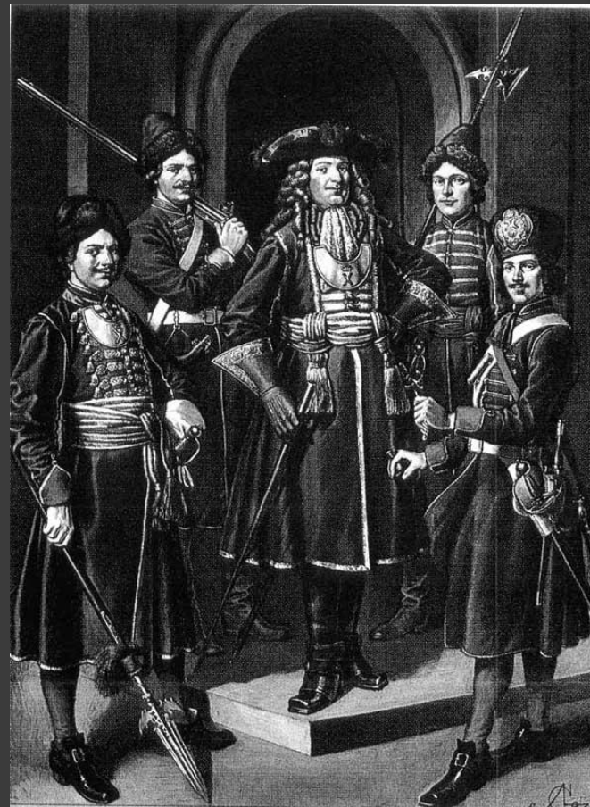
Летин "Служилое платье от Петра Великого. Гвардейские мундиры»