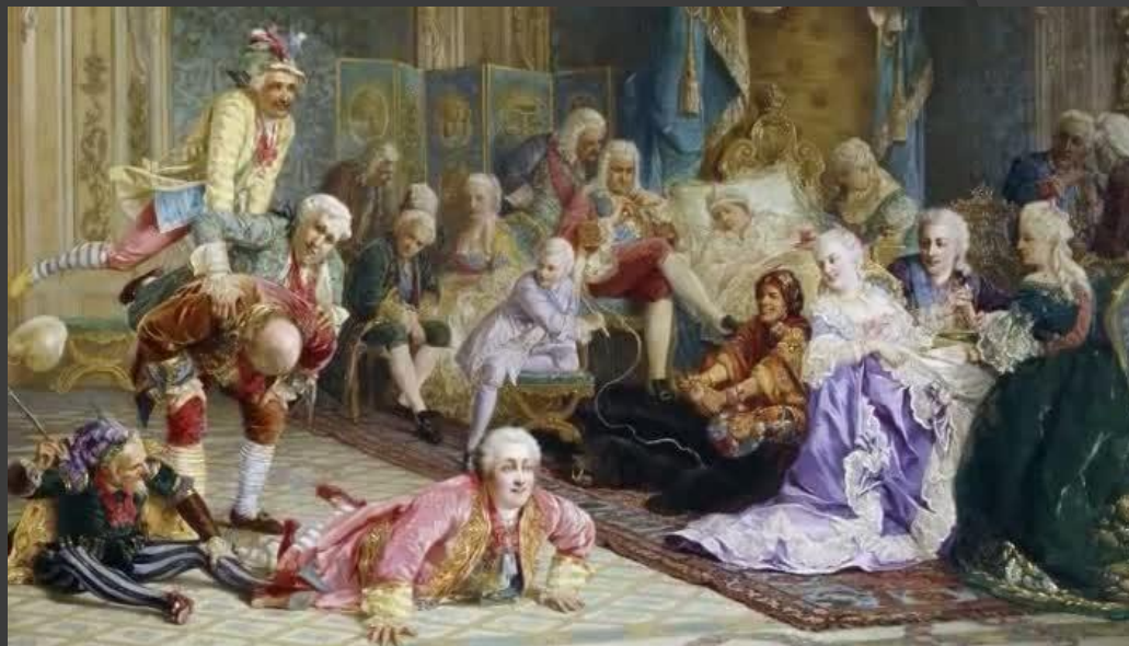
Шуты при дворе императрицы Анны Иоанновны.