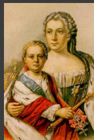
Иван VI Антонович Анна Леопольдовна