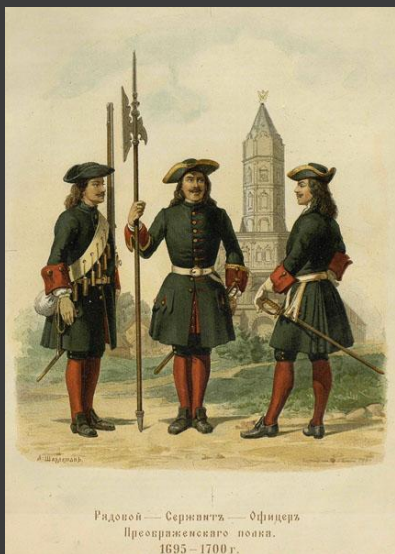
Рядовой — Сержантъ — Офицера Преображенскаго полка. 1695 — 1700 г.