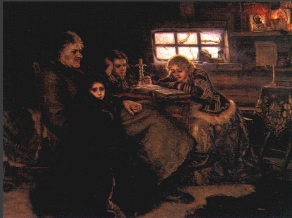
Суриков В.И. Меншиков в Березове.