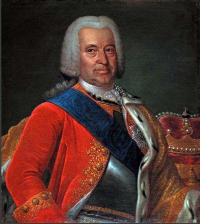
Эрнст Иоганн Бирон