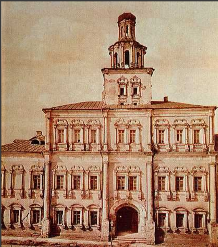
Первое здание Московского университета