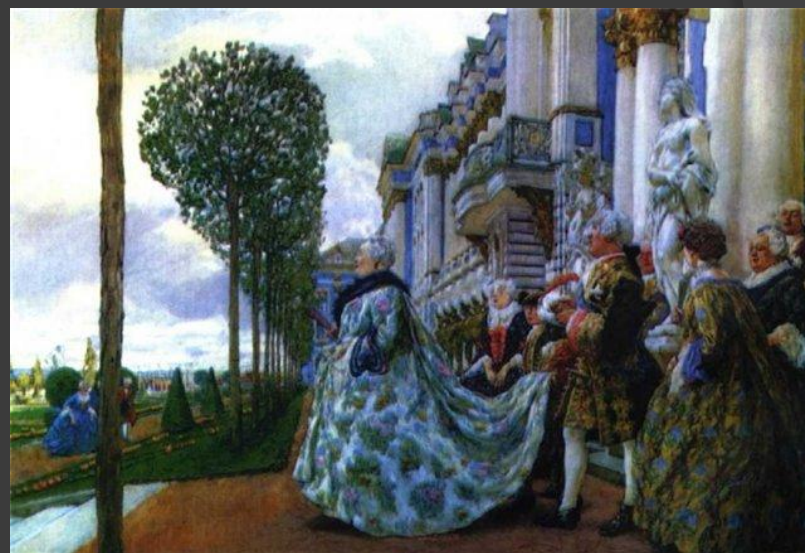
Императрица Елизавета Петровна в Царском Селе Е. Е. Лансере