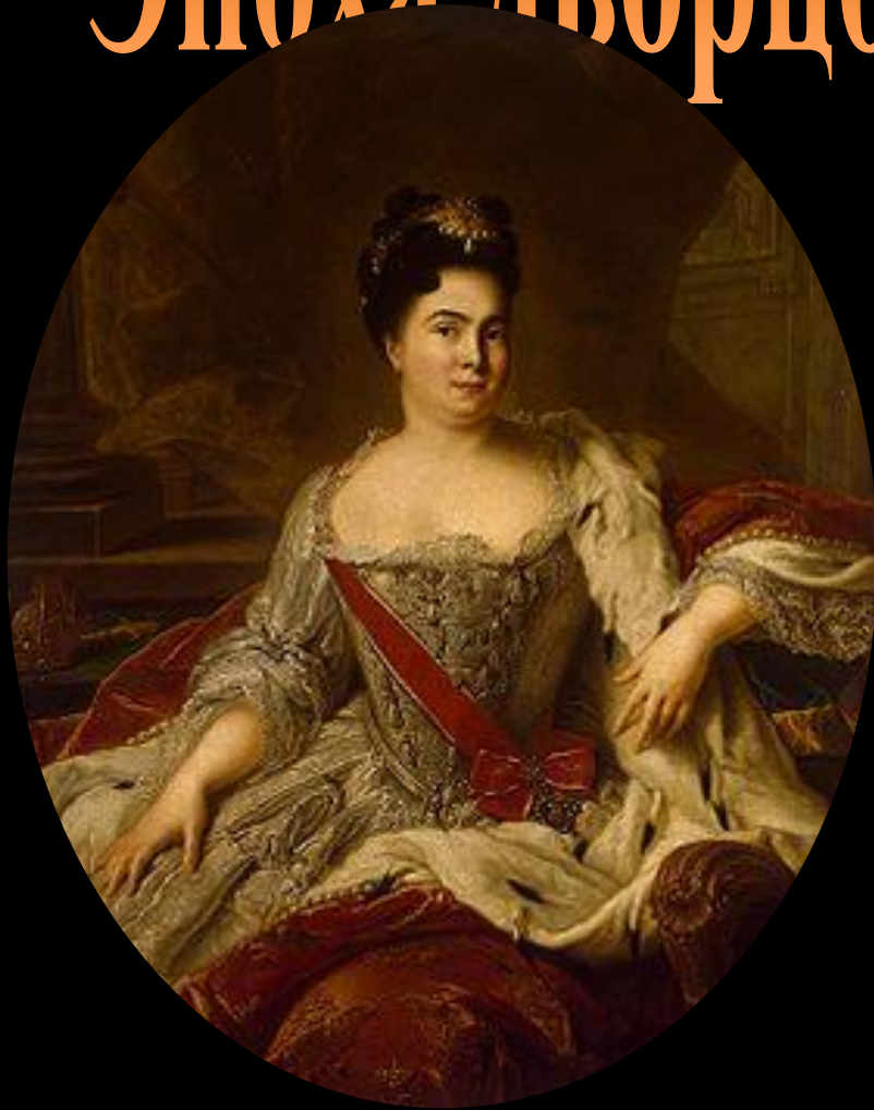
Екатерина I (1725-1727)