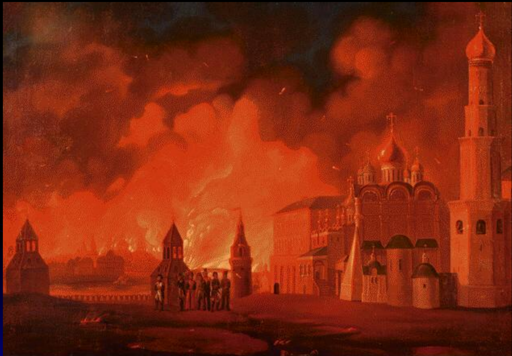
Moscow Fire 1812