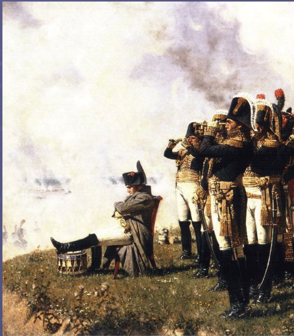
В.В.Верещагин. "Наполеон на Бородинских высотах". Из серии картин "1812 год". 1895 г. Фрагмент