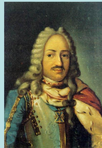
Франц Яковлевич Лефорт