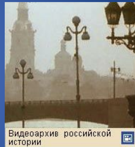
Видеоархив российской истории