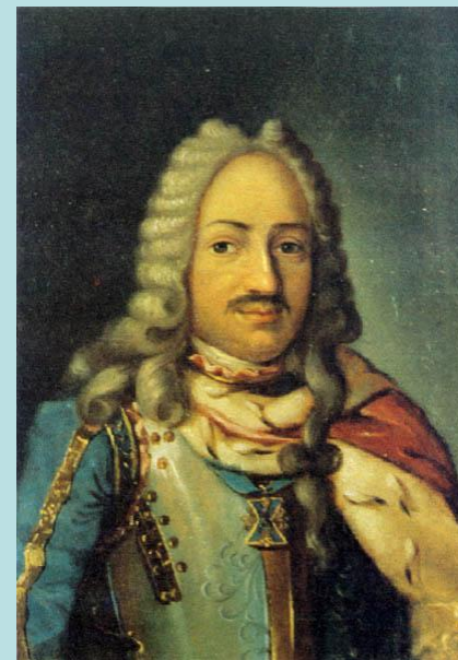
Франц Яковлевич Лефорт