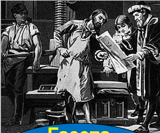
Газета «Ведомости » 1702г