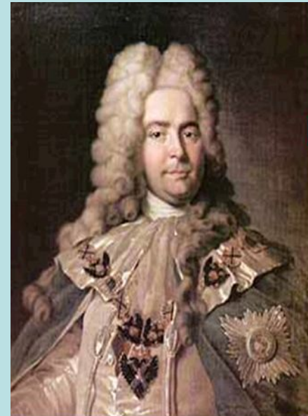
П. И. Ягужинский