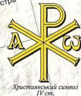
Християнський символ IV ст.