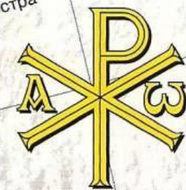
Християнський символ IV ст.