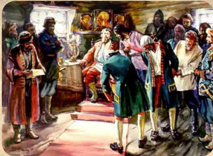
Емельян Иванович Пугачёв