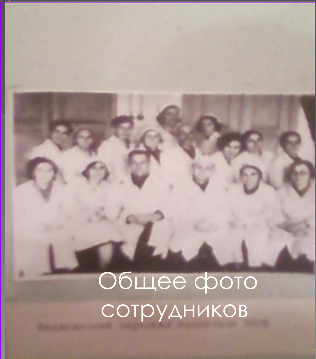
Общее фото сотрудников