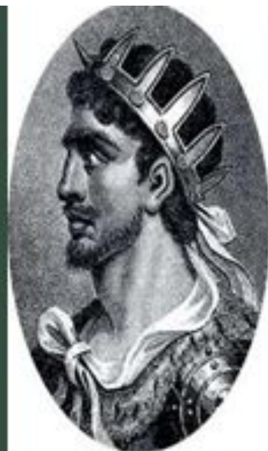
Welcome to Ossetia - Alania!

Ғұндар – көшпелі патриархалды ел. Оларды ақсақалдар кеңесі басқарды. Елді шаньюй биледі. Тақты атадан балаға мұраға қалдырып отырған. Ғұндардың өзіндік құқық қорғау жүйесі болған. Ауыр қылмыстармен опасыздық жасағандарға елім жазасы кесілген. Ал ұсақ қылмыстар үшін айыптының бетін тілген және т.б жазалар қолданған.