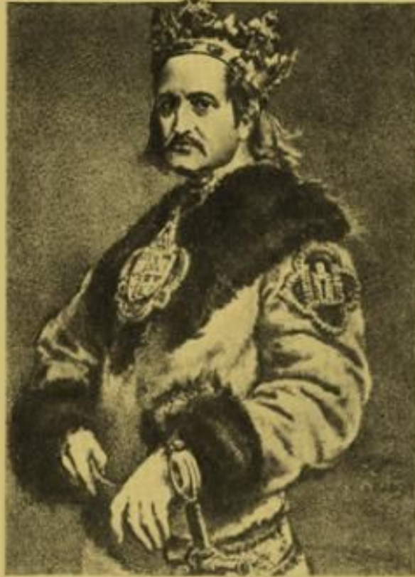
король польський і великий князь литовський Володислав II Ягайло