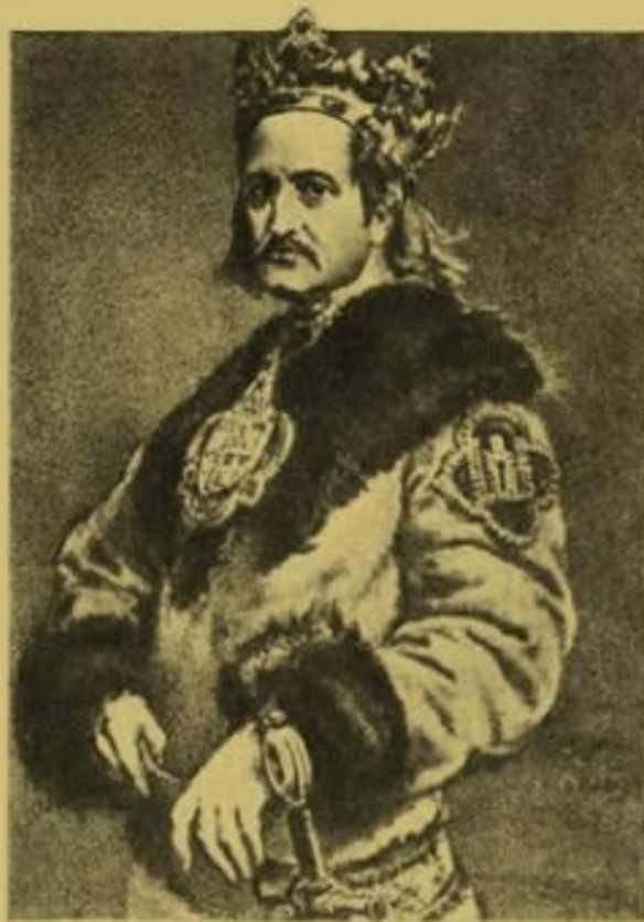
король польський і великий князь литовський Володислав II Ягайло