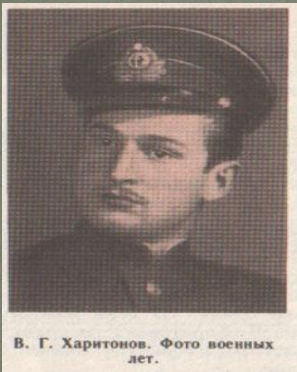
В. Г. Харитонов. Фото военных лет.