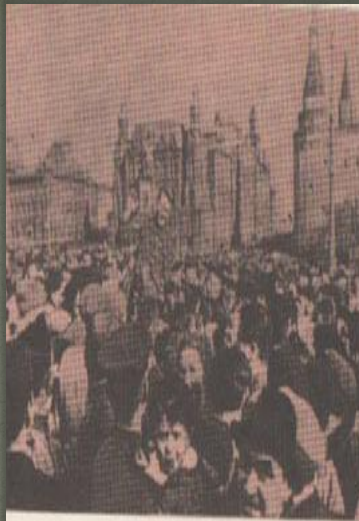
9 мая 1945 г. на Красной площади.

День Победы, как он был от нас далек, Как в костре потухшем таял уголек. Были версты, обгорелые, в пыли,— Этот день мы приближали как могли.