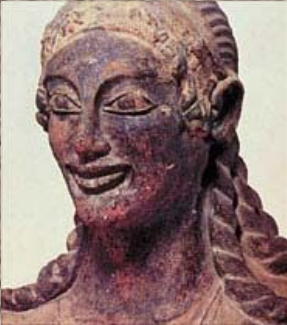
Аполлон из Вей

• Благодаря этрускам римляне освоили технику монументального строительства и научились создавать города с регулярной планировкой кварталов и улиц. Многие современные города Италии (Болонья, Перуджа, Орвьето, Ареццо и др.) стоят на месте этрусских городов. В Риме сохранились остатки канализационной системы созданной этрусками. В Перудже и Вольтерре можно видеть фрагменты стен из крупных каменных блоков и арочные проемы ворот.