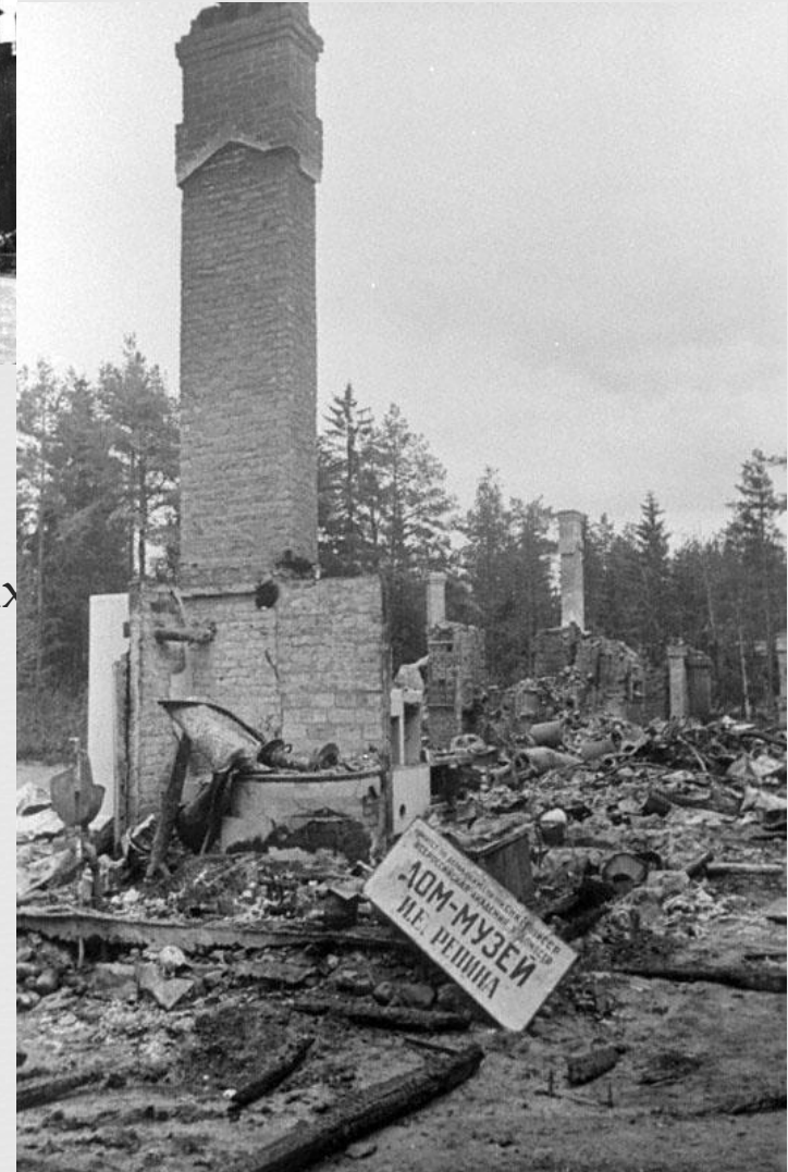
Музей-усадьба И.Е. Репина в Пенатах