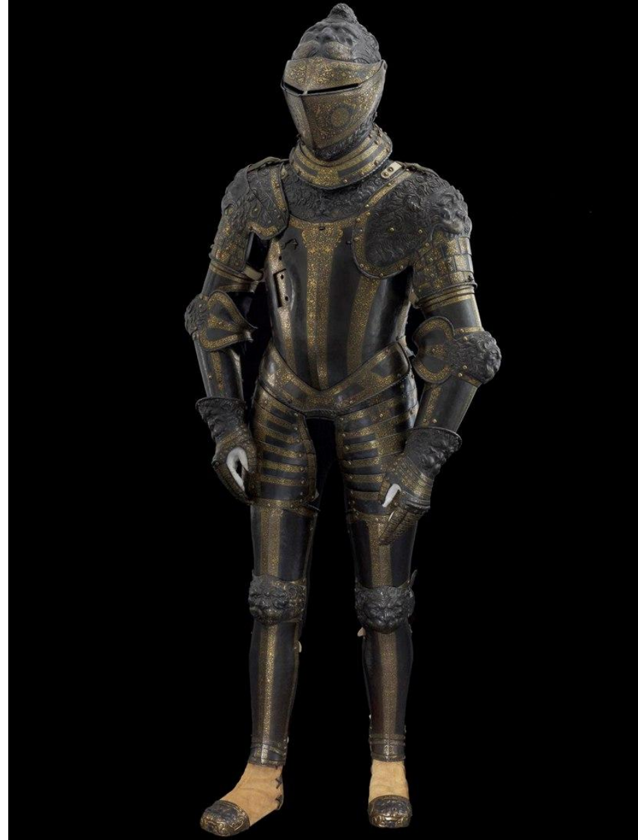
Львиный доспех короля Франции Генриха II 1550-й год.

□К началу XV века латы полностью вытеснили кольчугу, и рыцарские доспехи перешли в другое качество. Металл стали украшать позолотой и чернью. Если же металл был без украшений, то его называли "белым".