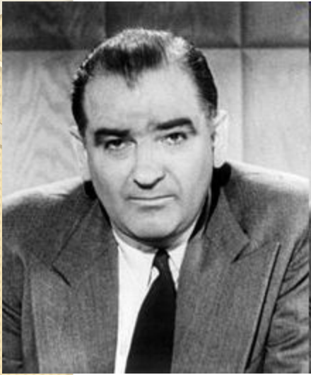
Джозеф Реймонд Маккарти (1908-1957) - американский сенатор- республиканец