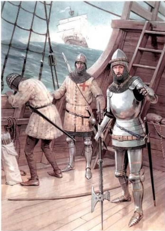
На борту корабля, около 1410 г.

Рыцарь - средневековый дворянский почётный титул в Европе.