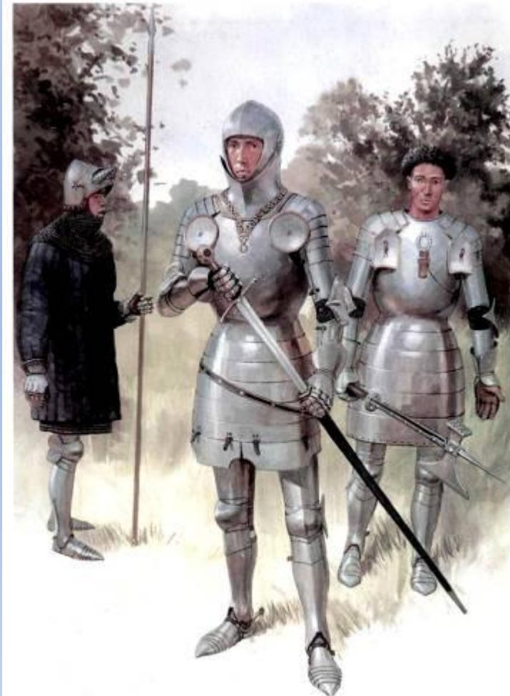
Рыцари раннего периода