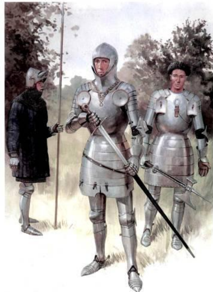
Рыцари раннего периода