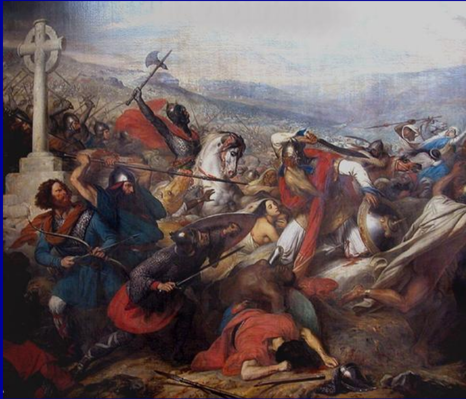
Битва у Пуатье