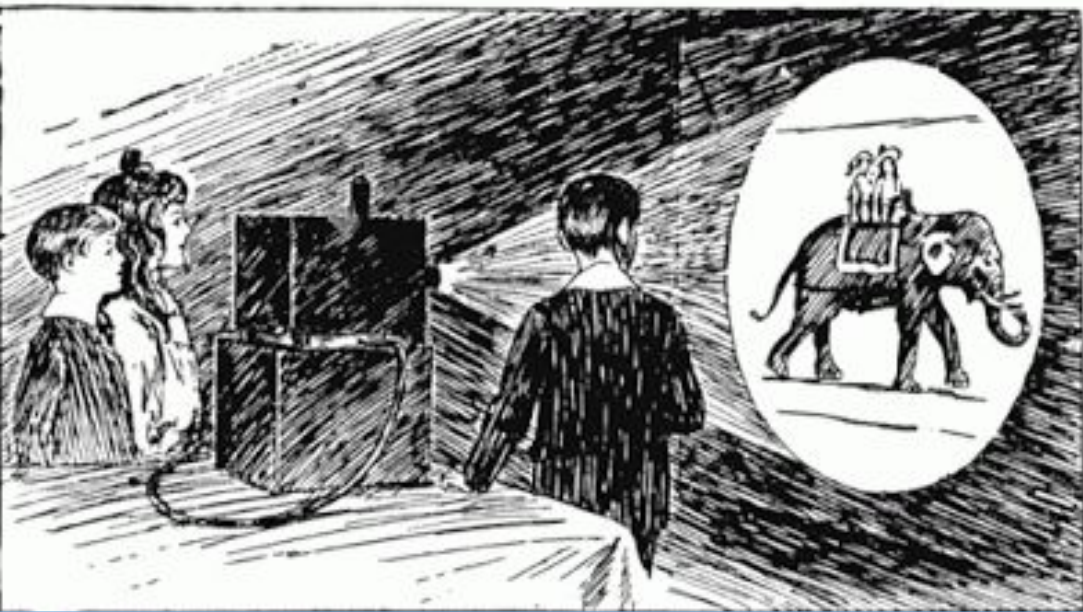
1870 год

Памятник британским офицерам в Дели. В панели вокруг основания, есть запись: 2163 солдата и офицера были убиты, ранены или пропали без вести с 8 июня по 7 сентября 1857 года .