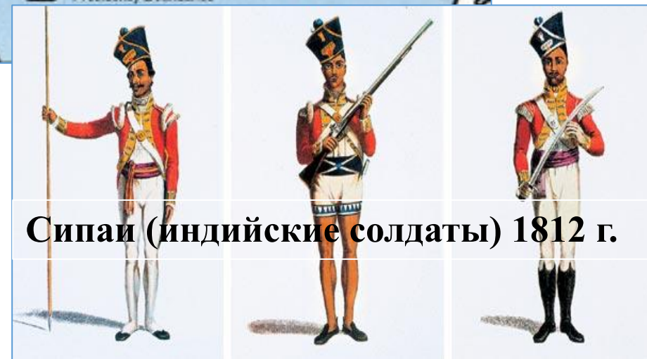
Сипай (индийские солдаты) 1812 г.