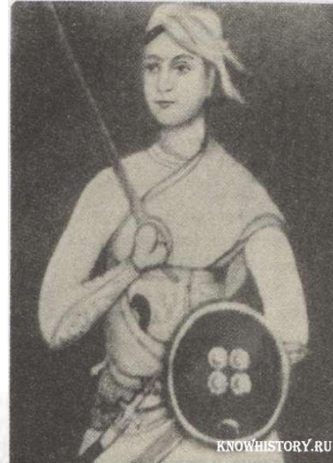
Рани Лакшми Бай - лидер восстания 1857 г.