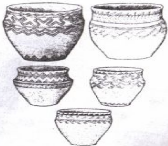
Орталық Қазақстандағы Андронов мәдениетінің Атасу кезеңіндегі қыш ыдыстар