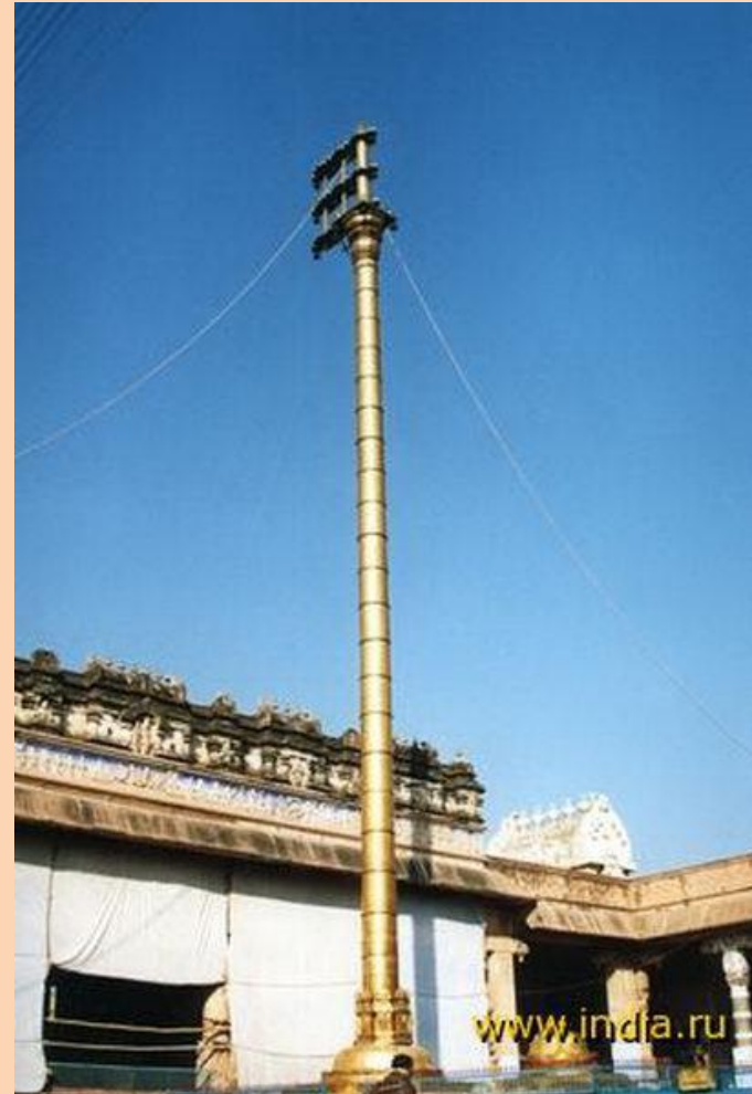
Алтын стамбха ( 500 кг алтын)