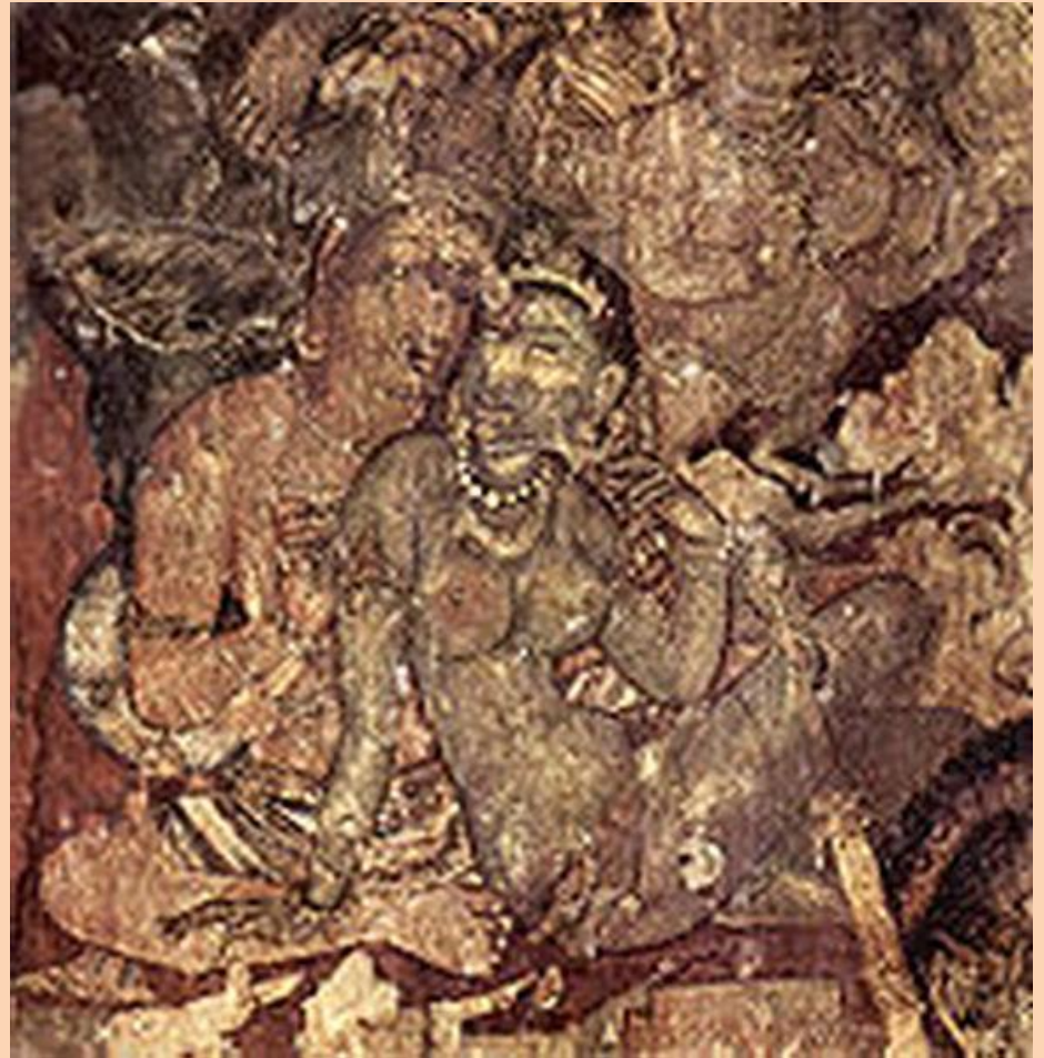
Ежелгі фреска (Аджант)