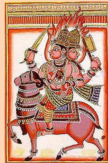
Агни – от құдайы