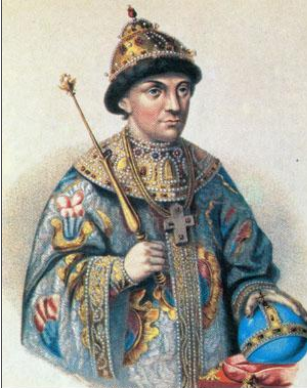
Федор Алексеевич (1661-1682)