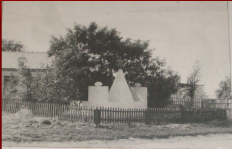
с. Глубокое Погибшим красным партизанам в боях с колчаковцами в 1919г.

Не все партизаны вернулись домой. Некоторые погибли в боях, их с почётом похоронили в центре села на площади в братской могиле. Вначале их было 8, затем дохоронили ещё двоих.