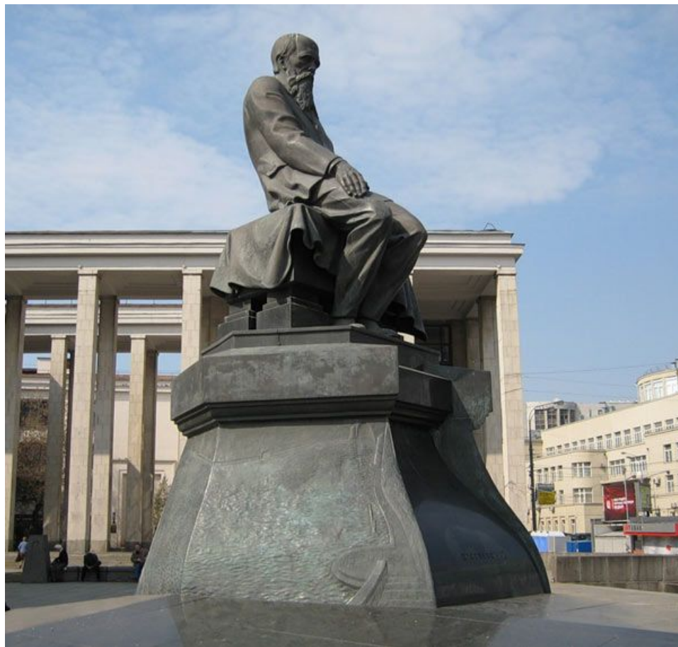
Памятник Достоевскому, метро Кропоткинская.