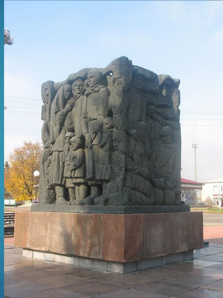
Меморіал жертвам Корюківської трагедії