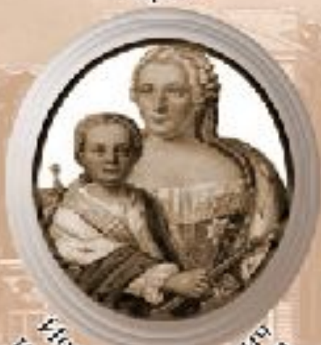
Иоанн Антонович и Анна Леопольдовна