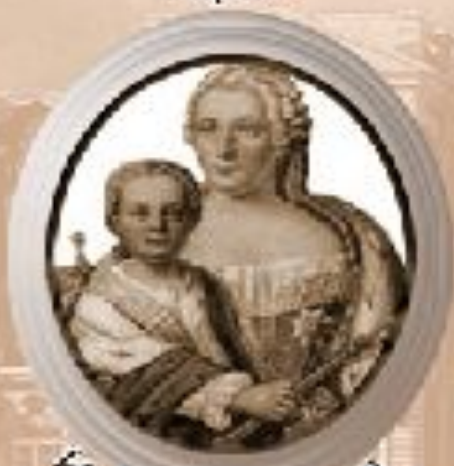
Иоанн Антонович и Анна Леопольдовна