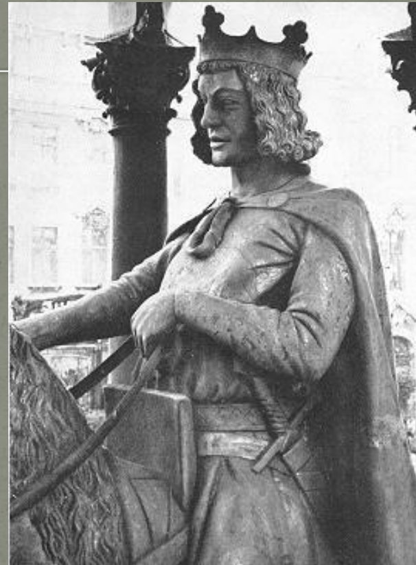
Оттон I Великий