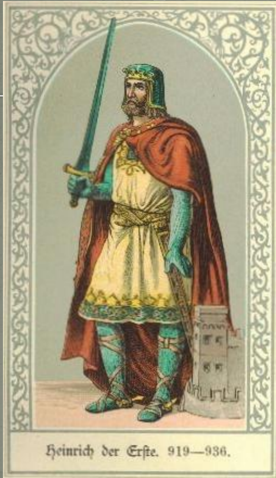
Генрих I Птицелов