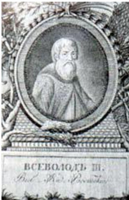
Всеволод Большое Гнездо