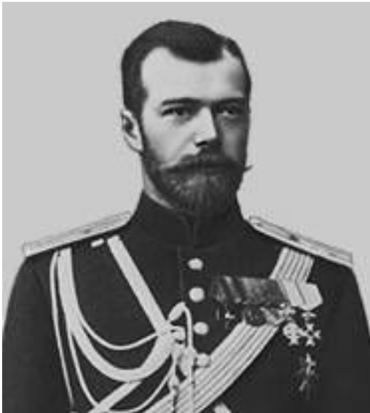
Император Николай II (1868 – 1918)