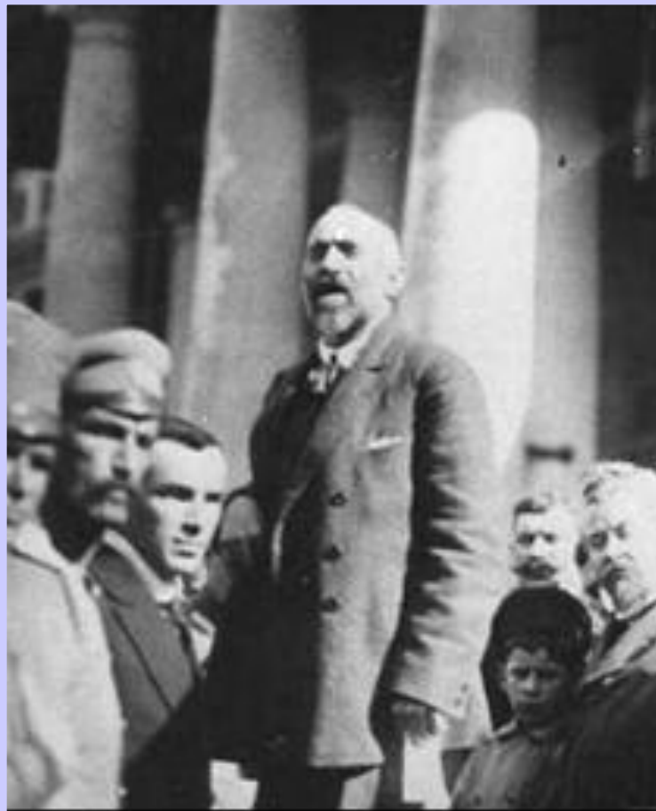
Н. Чхеидзе. Председатель Петроградского Совета.

1 марта было создано Временное правительство во главе с Г. Львовым. Министром иностранных дел стал П. Милюков, военным - А. Гучков. Заместитель Петросовета А. Керенский стал министром юстиции. Совет 1 марта издал приказ №1 по которому практически подчинил себе армию. Поэтому реальная власть в стране принадлежала ему. Но лидеры Совета считали, что если революция носит буржуазный характер, то у власти должна быть буржуазия.